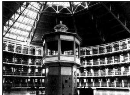
O panóptico, prisión moderna

Porque neste sitio, como en calquera outro, a liberdade non gusta, e arranxan magnificamente para contela, reducila ou limitala ao máximo. O poder de ir e vir, de circular libremente sen trabas, de moverse sen ter que dar explicacións; o de facer uso como un desexa do seu tempo, todo iso que pon de manifesto a autonomía do individuo (a posibilidade de decidir sobre a súa existencia con todo detalle), incomoda considerablemente á sociedade no seu conxunto. De aí que a sociedade inventase certo número de institucións que funcionan segundo técnicas de control : control do voso espazo e tempo.